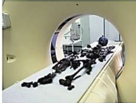
Oldtid og nutid samlet i et enkelt billede: Auning-kvinden i moderne ct-scanner på regionshospitalet.

Som nævnt i Randers Amtssavis for nylig, har Auning-kvinden skrumpet hoved, fordi man tilbage i 1880'erne, da hun blev fundet, skar kraniet ud af hende, udstoppede hovedhuden med vat og rimpede hovedet sammen. Det tørrede i løbet af kort tid ind. Derfor skrumpet hovedet.