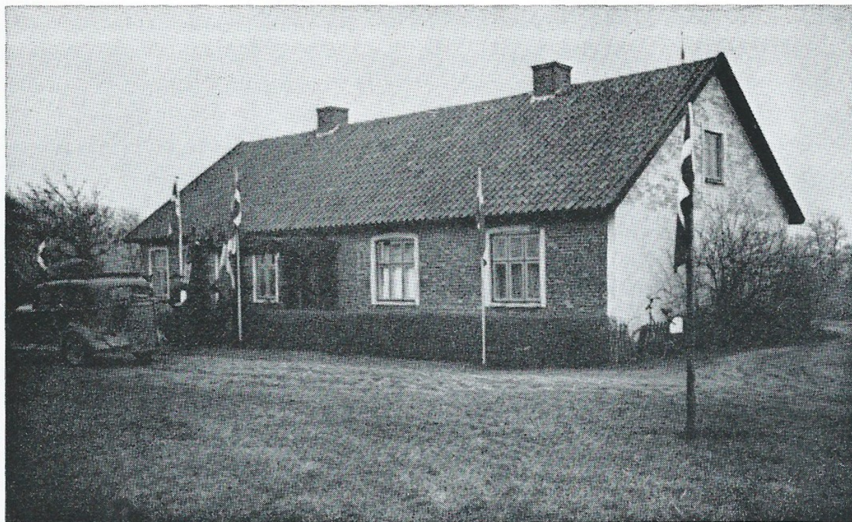
'Lægeboligen' i Tværsgie, til hvilken utallige søgte for at finde hjælp. Billedet er taget under besættelsen.