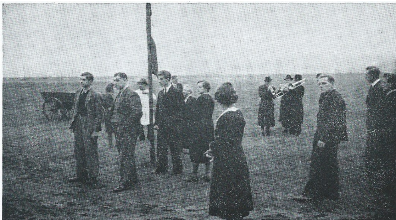
Musik, sang og flaghejsning på en mærkedag.

bryllup på Tværsige, hvortil det var en fast tradition, at sangkoret fuldtalligt mødte op kl. 5–6 i den skønne forårmorgen og „vækkede“ parret med korsang, – først „Morgensang af elverskud“, derefter flag-sangen, mens dannebrog gled til tops, – og senere ved morgenbordet – næsten udelukkende forbeh. sangere – endnu flere sange og salmer, – ja, vi kan sige med Grundtvig: Som det de ville ej med kongers bytte.