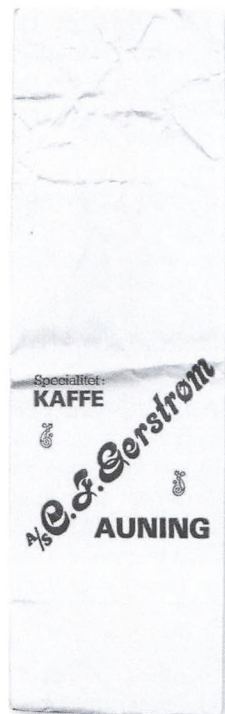
Kaffepose fra Gerstrøm

Betjening af kunder i forretningen havde naturligvis alt afhængig af presset første prioritet, men ligeså vigtigt var det sideløbende at pakke ordrer til de stort set daglige landture. Ordre der var enten indtelefoneret eller indleveret på håndskrevne indkøbs-sedler eller i den kontrabog med en forud aftalt kredit, typisk ugentlig eller månedlig, som en stor del af kunderne benyttede sig af. Udover landture, som forretningen selv stod for, var der et par landmænd, der kørte ugentlige landture til naboer i eget lokalområde.