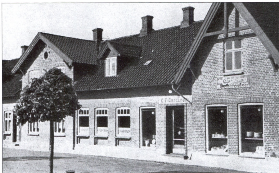
Gerstrøms købmandsgård i 1945.