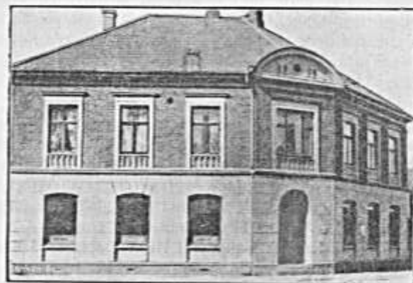
„Rougso-Sønderhald Herreders Folkebank“ i Auning.

De Betæneligheder, der før Bankens Start kom til Orde, blev grundigt gjort til Skamme allerede i Bankens første Leve-aar, idet Totalomsætningen da naaede op paa det smukke Tal: 9 Millioner Kroner. At Banken ikke senere er bleven overflø-dig, beviser Regnskabet fra sidste Regnskabsaar 1917—18; da var Totalomsætningen nemlig ikke mindre end 52 Millioner Kr. I 1917 fik Allingaabro-Afdelingen sin egen Bygning, en anselig, næsten monumental Hjørneejendom tæt ved Allingaabro Station.