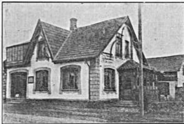
N. Chr. Jensens Mobelforretning og Madrattsfabrik.

Auning Mejeri byggedes samme Aar som Savværket. I Aarene forud havde Mælkeproducenterne i Auning leveret deres Mælk til forskellige Mejerier i Nabolaget. Nu stiftedes altsaa