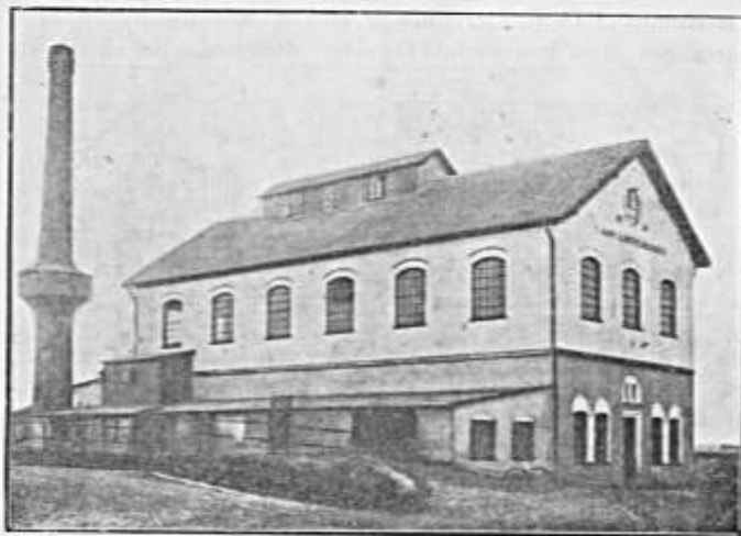
Dansk Kartoffelmelsfabrik Akts.