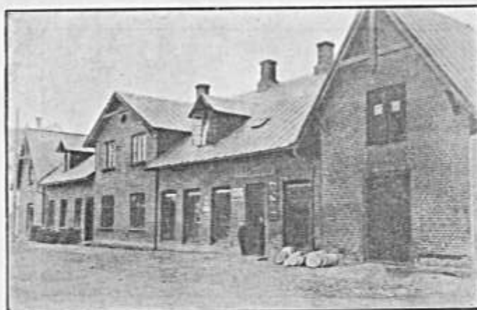
C. F. Gerstrøms Forretningsbygning.