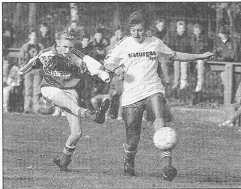
En Auning-spiller fyrer et skud af mod Valdemarskolens mål.