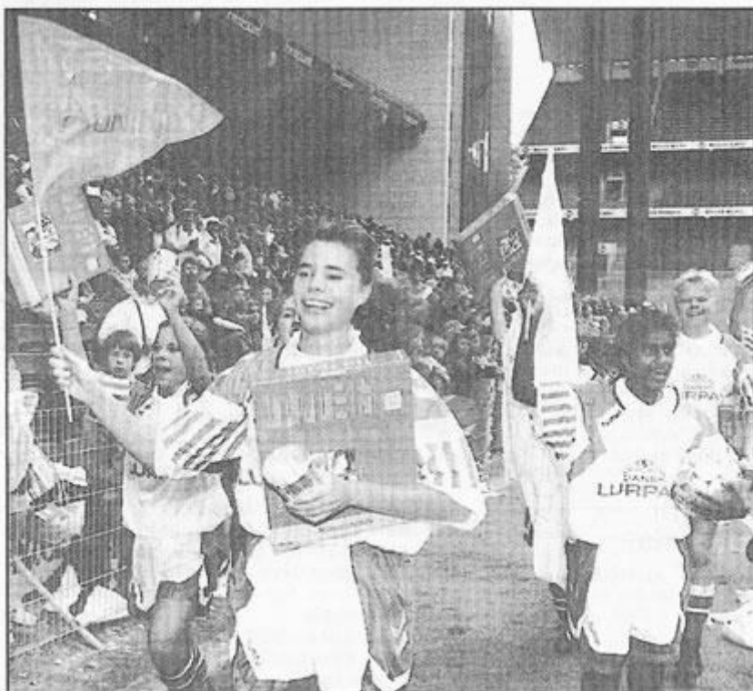
Danmarks-mestrene i jubel efter finalesejren i Parken.