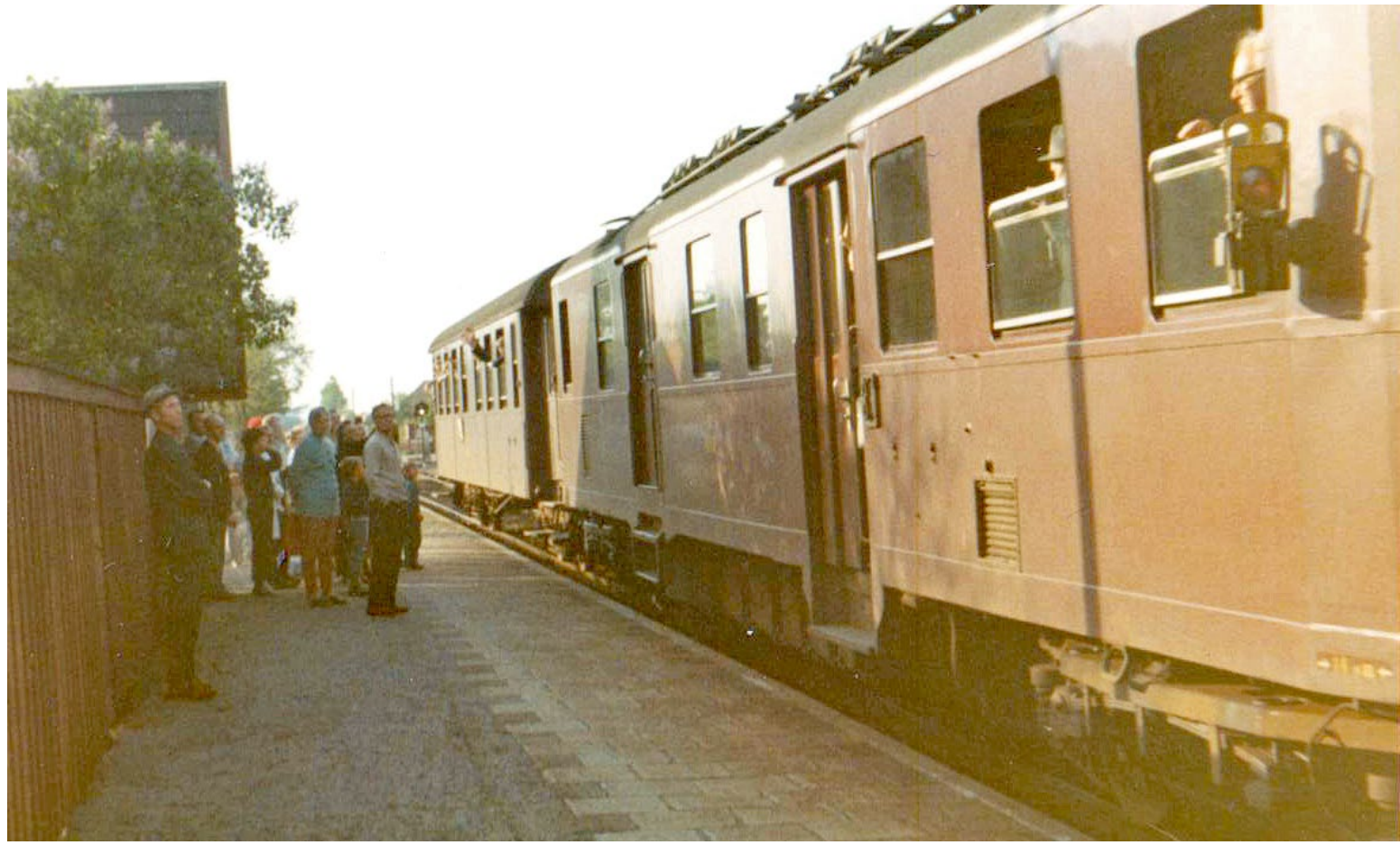
Sidste persontog kører fra Auning Station i 1971.