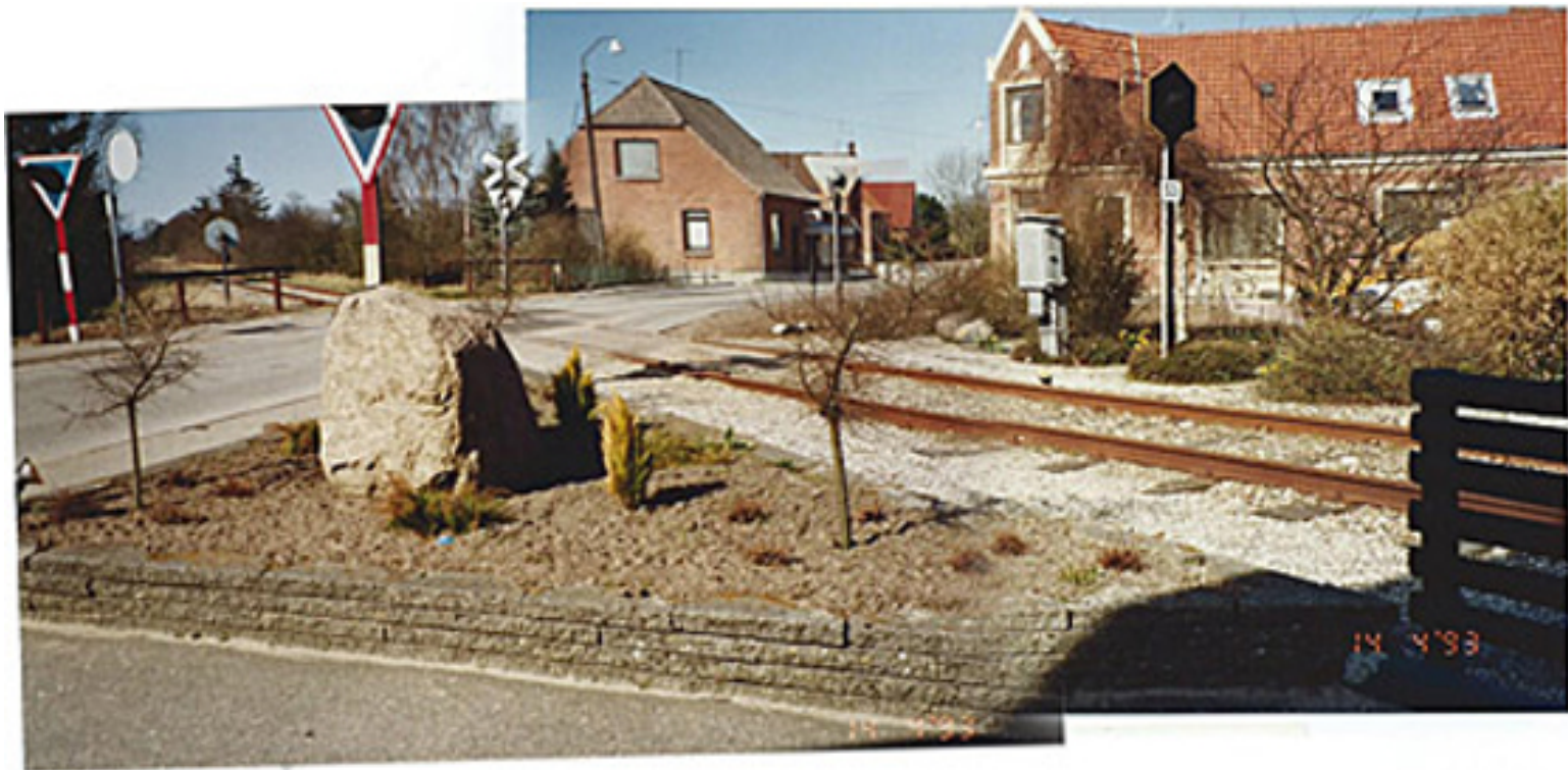
Baneoverskæringen i Kirkegade 1993.