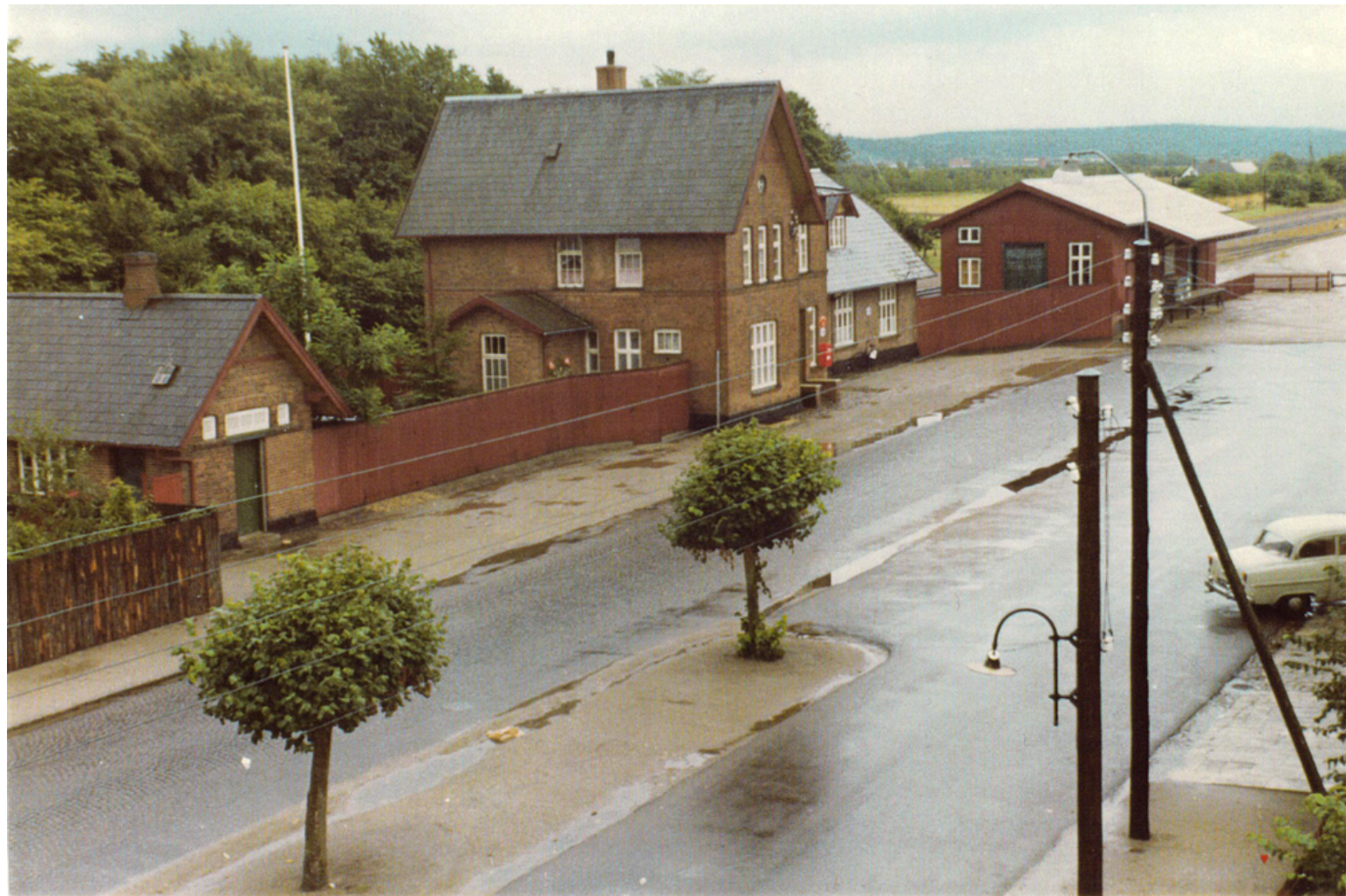
Auning Station i 1968. Her ses den brolagte vej, som blev anlagt parallelt med Torvegade. Stationsbygningen er tegnet af den danske jernbanearkitekt N.P.C. Holsøe.