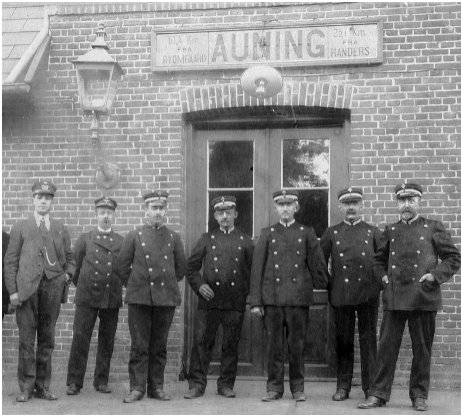
Stationspersonalet og postbude på perronen foran ventesalen den 5. maj 1918. Fotograferet af Th. West.