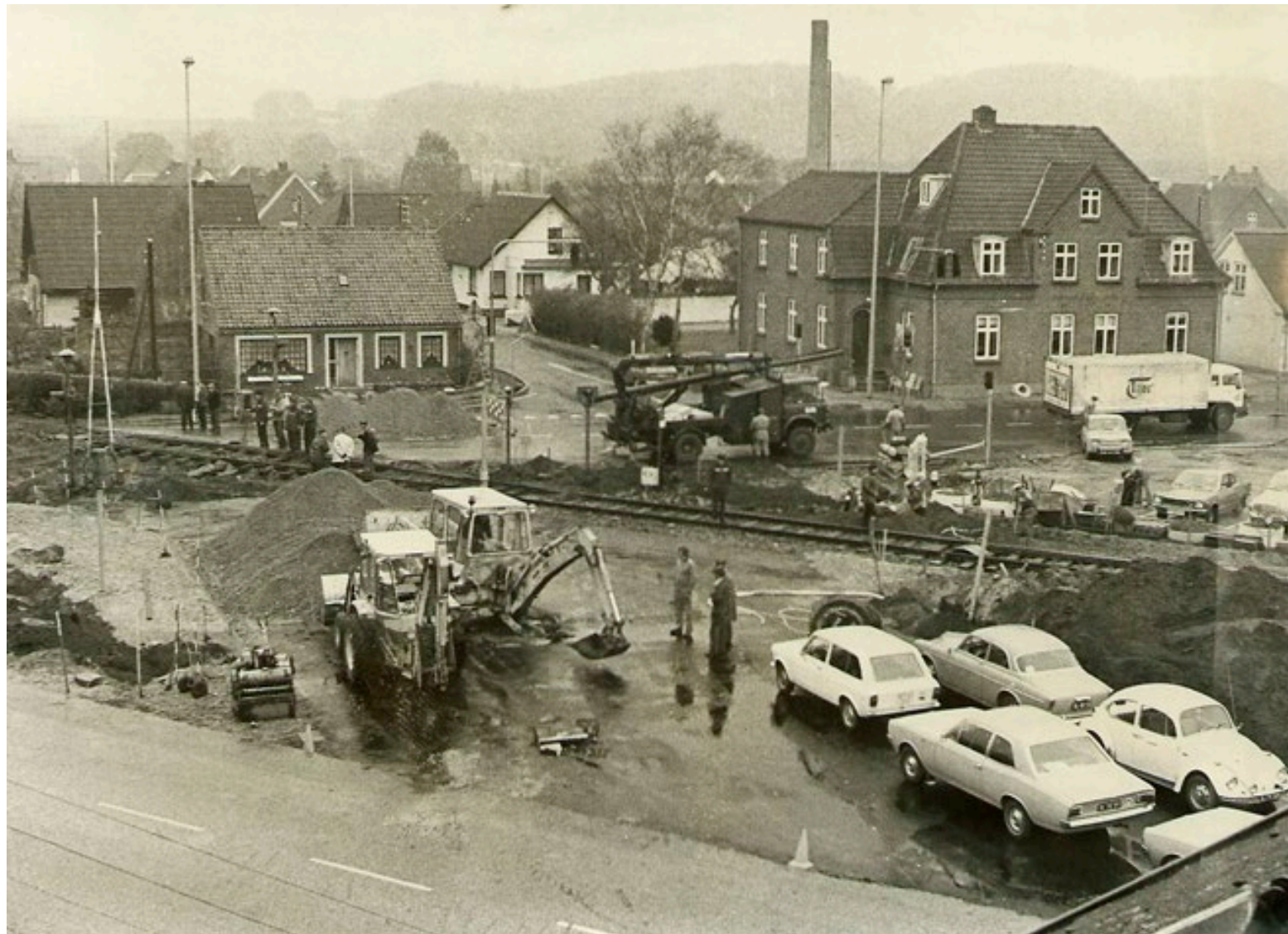
Sporarbejde i 1970erne.