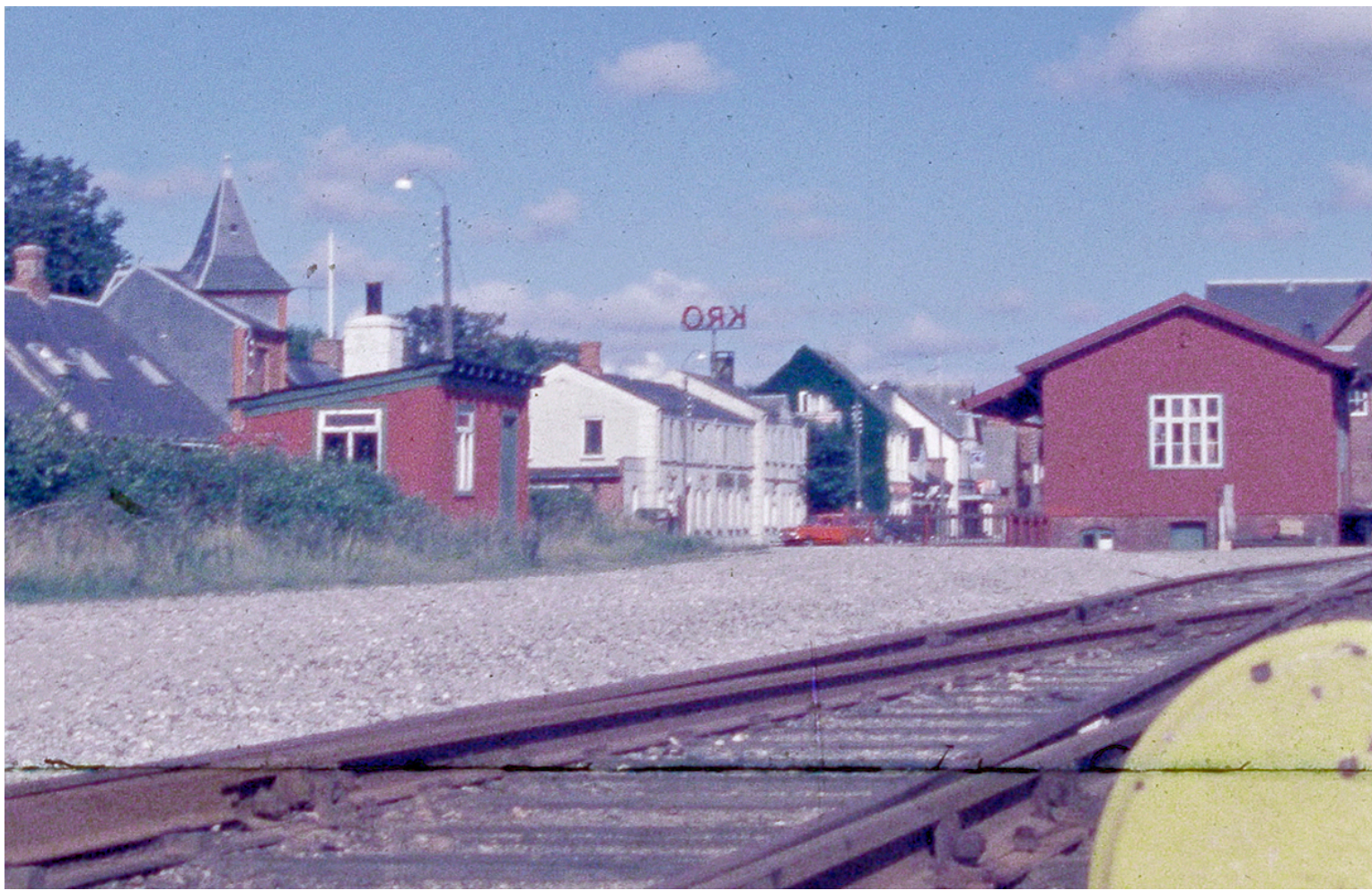
Pakhuset (til højre) og dele af Torvegade i 1972.