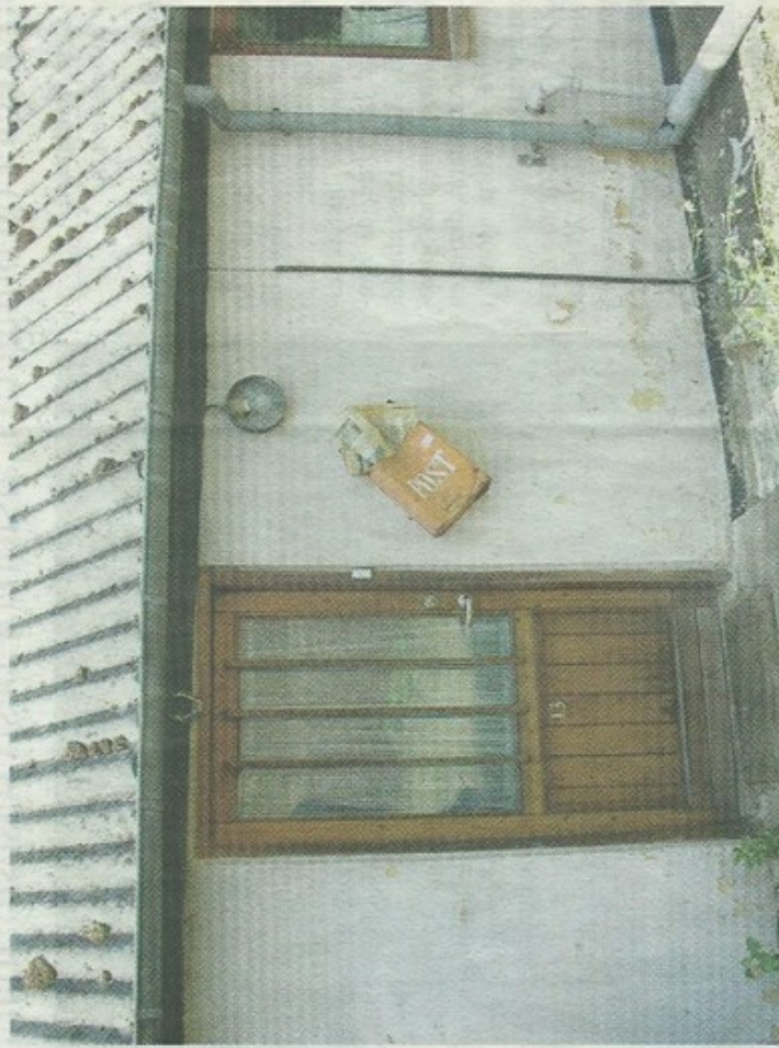
Det tomme hus i Kirkegade skulle, efter hvad ungdomsskolens leder erfarer, bl.a. være blevet brugt af en gruppe unge som "sniffehule".

Et af de steder, hvor rygterne går om misbrug, er det tomme hus i Kirkegade, som forleden var ramt af en mystisk ildspåsttelse. Om