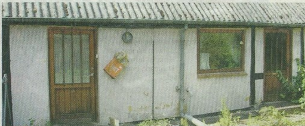
Det forlyder, at den ubeboede ejendom på Kirkegade 13 gennem et stykke tid har været samlingssted for en gruppe unge mennesker.

Politiet vil gerne i kontakt med en gruppe unge mennesker, der har brugt ejendommen som samlingssted.